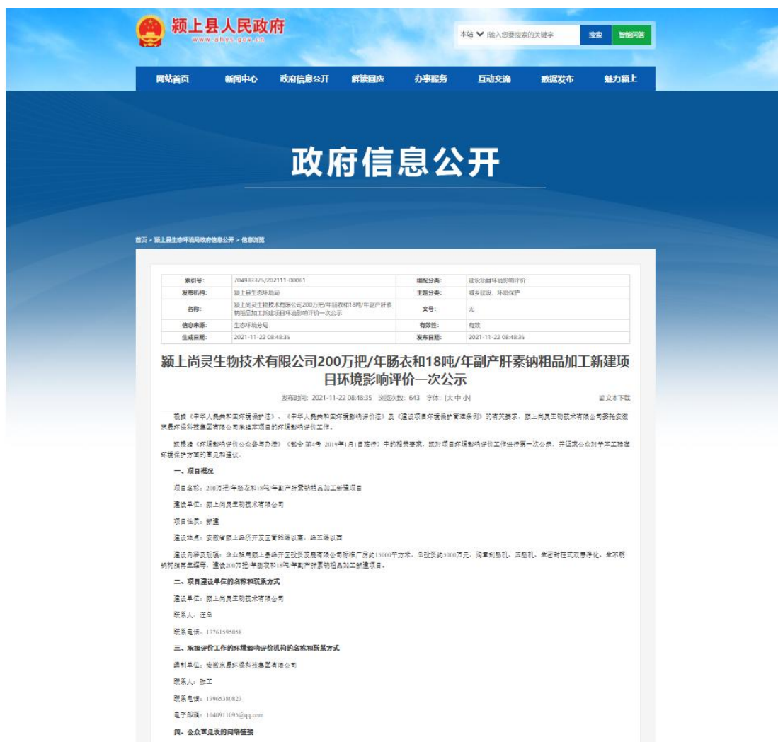
图 2-1 第一次网络公示截图