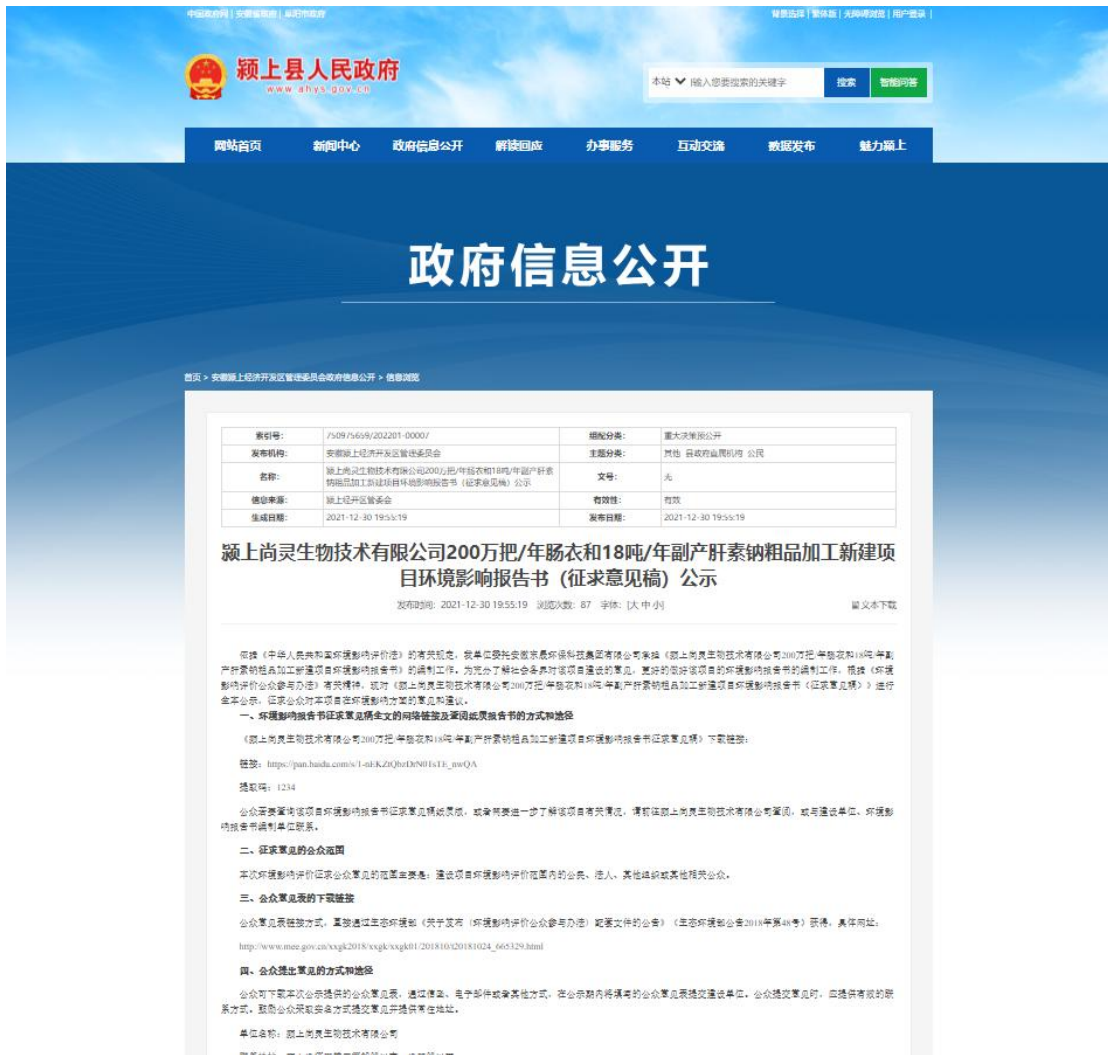
图 3-1 第二次网络公示截图

2021年12月30日到2021年1月13日在颍上县人民政府网站进行了第二次网络公示，网址为： https://www.ahys.gov.cn/xxgk/detail/61d5592c886688a3298b4568.html ，公示的载体符合《环境影响评价公众参与办法》的要求。